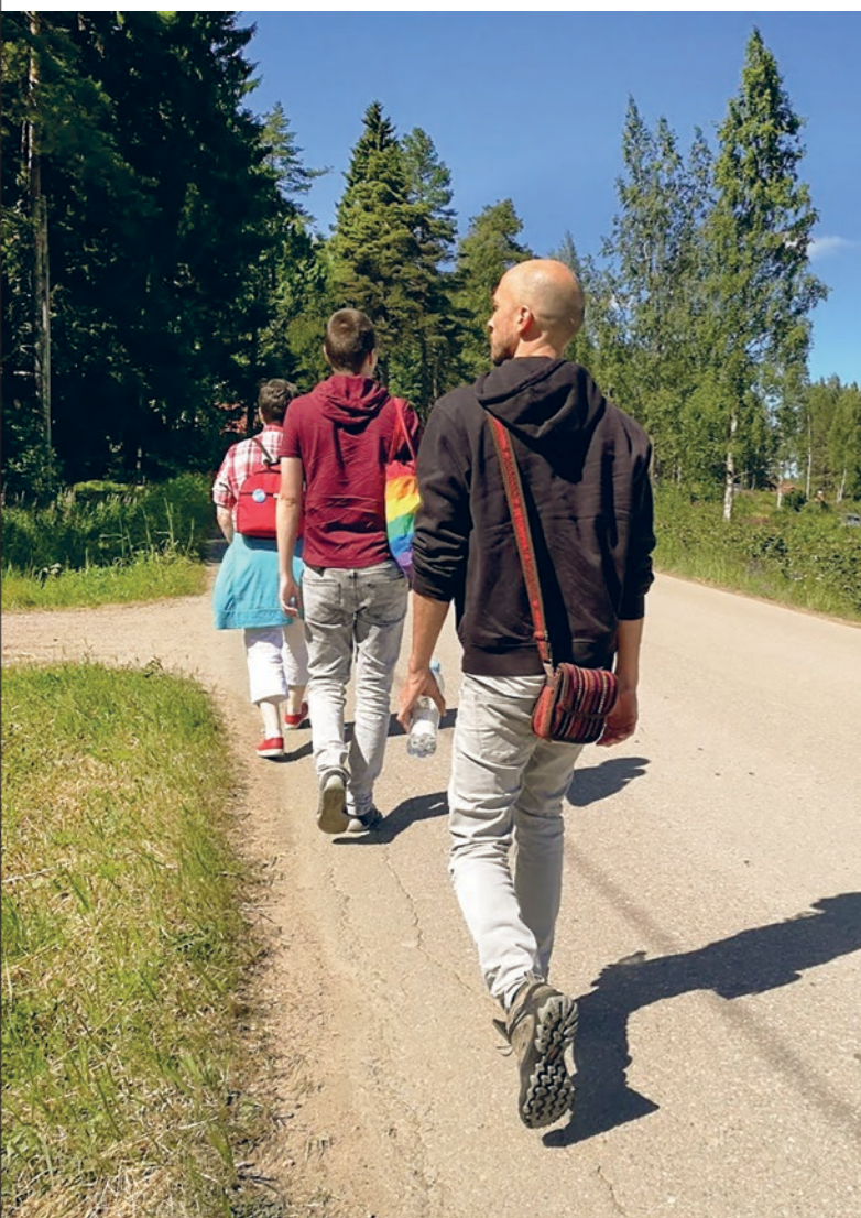
Verksamma i projektet Från börda till tillgång på väg till gammallaestadianernas sommarmöte i Äänekoski 2018 i sällskap av en regnbågsperson som vuxit upp inom gemenskapen.